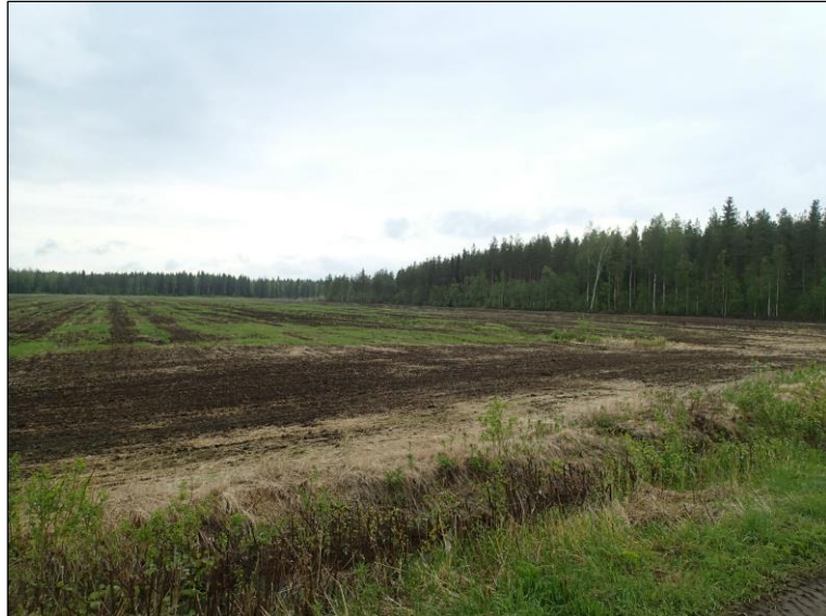
Voimajohtolinjaus kuvan keskellä luoteeseen suopellossa