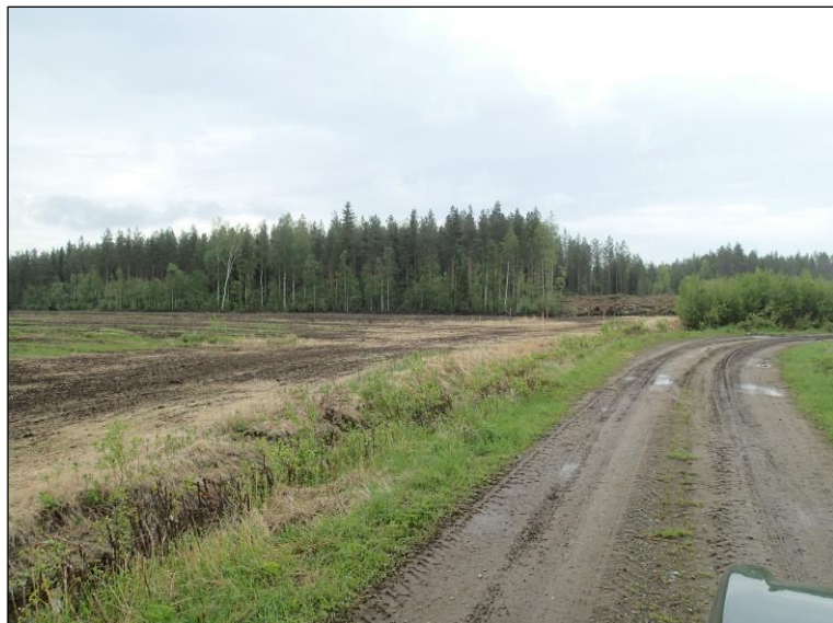
Linjauksenkaakkoispää tienvarren pusikon kohdilla. taustalla Jussinkangas.