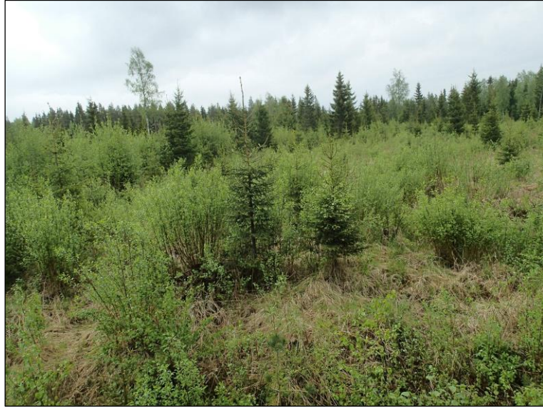
Maastoa linjalla Vuolunojan laitamilla.